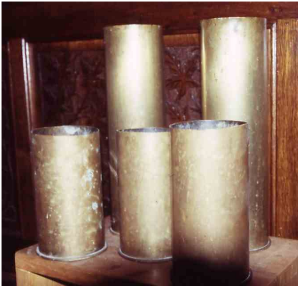
Granat-Hülsen in der Pfarrkirche Gramastetten

Wie erzählt wird, werden Flak-Kartuschen (Hülsen von deutschen Fliegerabwehrgranaten aus dem Zweiten Weltkrieg) in Gramastetten in Privathaushalten aufbewahrt und finden in der Pfarrkirche Verwendung als Blumenvasen. Auch im Buch 900 Jahre Gramastetten wurden diese Kriegsrelikte als deutsche Flak-Kartuschen beschrieben. 1